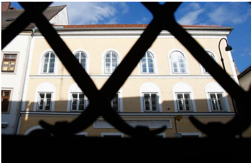
Дом в австрийском городе Браунау-ам-Инн, где родился Адольф Гитлер

По мнению властей, изъятие дома с выплатой компенсации хозяйке остается единственным способом, при котором здание не смогут использовать неонацисты